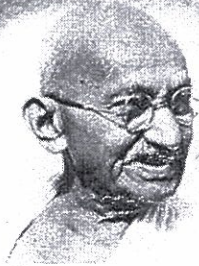
Mahatma Gandhi Indian Political Leader (1869-1948)

The Roots of Violence: Wealth without work, Pleasure without conscience, Knowledge without character, Commerce without morality, Science without humanity, Worship without sacrifice, Politics without principles.